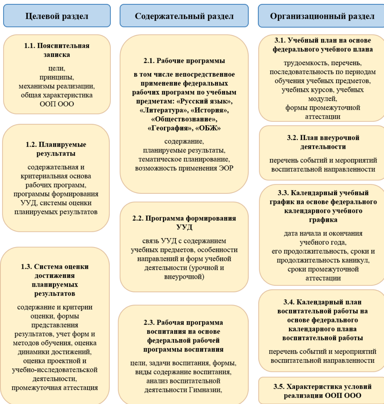
Схема 2. Структура ООП ООО