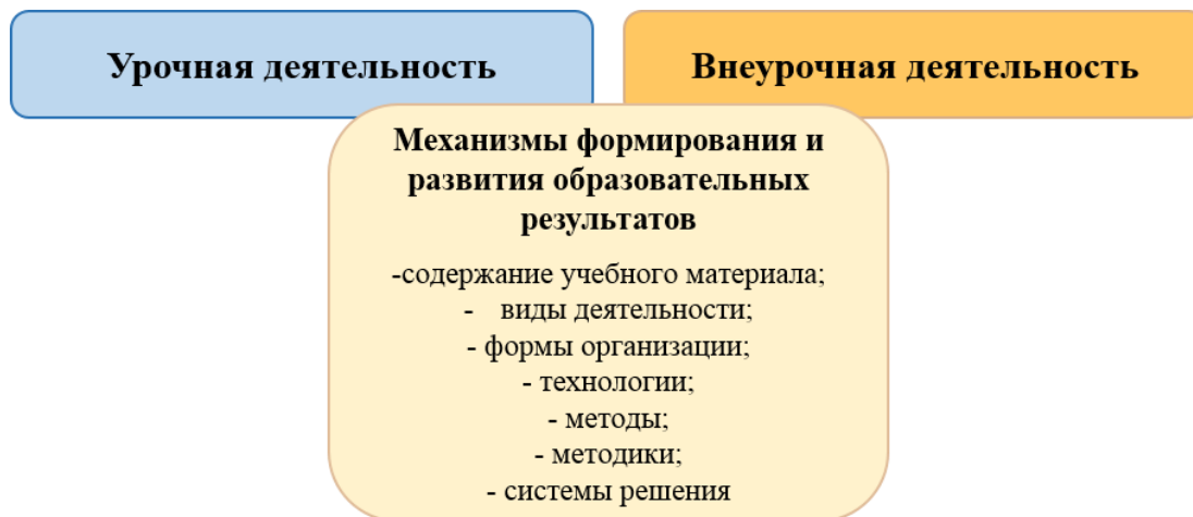
Схема 3. Механизмы формирования и развития образовательных результатов

Личностные, предметные и метапредметные результаты достигаются в единстве урочной и внеурочной деятельности (схема 2).